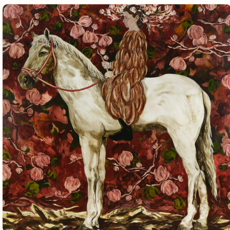
Florence Dussuyer, Les Gardiennes 2 , 2023, technique mixte sur toile

En juin, l'artiste Florence Dussuyer a présenté son exposition solo « Faire-corps ». Ses peintures monumentales ont transporté les visiteurs dans un univers onirique, peuplé de figures féminines mystiques, créées dans son atelier situé à quelques rues de là.