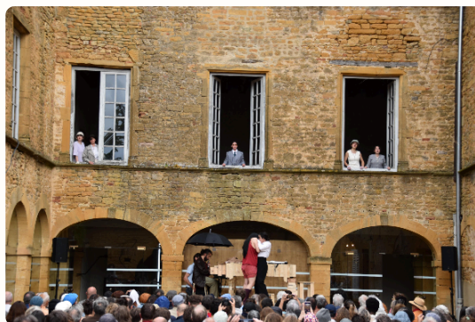
Quat'Sous trois quarts D'après Bertolt Brecht Mise en scène de Lorris Dessard Compagnie L'Écho des tiroirs

En juin, près de 1 000 spectateurs ont applaudi les comédiens du Théâtre en Pierres dorées et des compagnies invitées pour la treizième édition des Rencontres de Theizé . Les festivaliers ont pu y découvrir des talents de la région comme la compagnie Diak'Art Lo ou le collectif L'Écho des tiroirs.