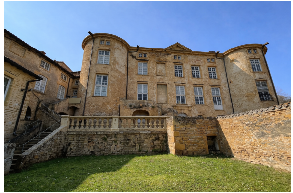
Projection de la balustrade rénovée (après)