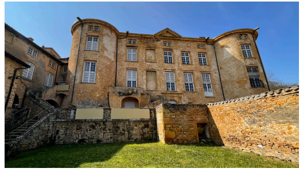
Balustrade actuelle (mars 2026)